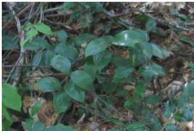
Иглица колхидская ( Ruscus colchicus P. F. Уео) — вид, занесенный в Красную книгу РФ

Единственная классификация редких сообществ, встречающихся в зоне распространения пихтовых лесов Кавказа, предложена С. А. Литвинской [23]. В соответствии с ней к редким сообществам в частности были отнесены сообщества с доминированием самшита Buxus colchica Pojark. и овсяницево-пихтово-буковые леса с тисом (как сообщества, средообразующую роль в которых играют виды, внесенные в красные книги, характеризующиеся неустойчивостью и тенденцией к сокращению ареала), а также овсяницево-пихтово-дубовые леса с подлеском из рододендрона желтого Rhododendron luteum Sweet, мертвопокровные буково-пихтовые леса, колхидскокустарниковые пихтарники и буково-пихтовые леса (как сообщества, в которых средообразующую роль играют виды, внесенные в красные книги, но характеризующиеся устойчивым ареалом). Для всех этих сообществ в качестве критического фактора указаны рубки. Но работа эта касается лишь западной части Краснодарского края и в очень малой степени охватывает пихто-