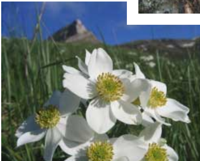
Ветреница кавказская ( Anemone caucasica Willd. ex Rupr.)

4, 5. Овсяницевые пихтарники распространены на небольшой площади. С ними связан ряд редких видов. В таких пихтарниках основная масса корней пихты сосредоточена на глубине до 0,5 м, поэтому после изреживания пихта подвержена ветровалам. Кроме того, при сомкнутости полога 0,5 и меньше овсяница препятствует естественному возобновлению [6]. Наиболее уязвимы пихтарники по вершинам хребтов и водоразделов. Поскольку древостой в таких пихтарниках разрежен и выборочные рубки даже небольшой интенсивности ведут к снижению сомкнутости ниже 0,5, в овсянице-вых пихтарниках по вершинам хребтов любые рубки должны быть исключены. То же относится и к вейниковым пихтарникам, в которых вейник затрудняет естественное возобновление при сильном изреживании древостоя [6].