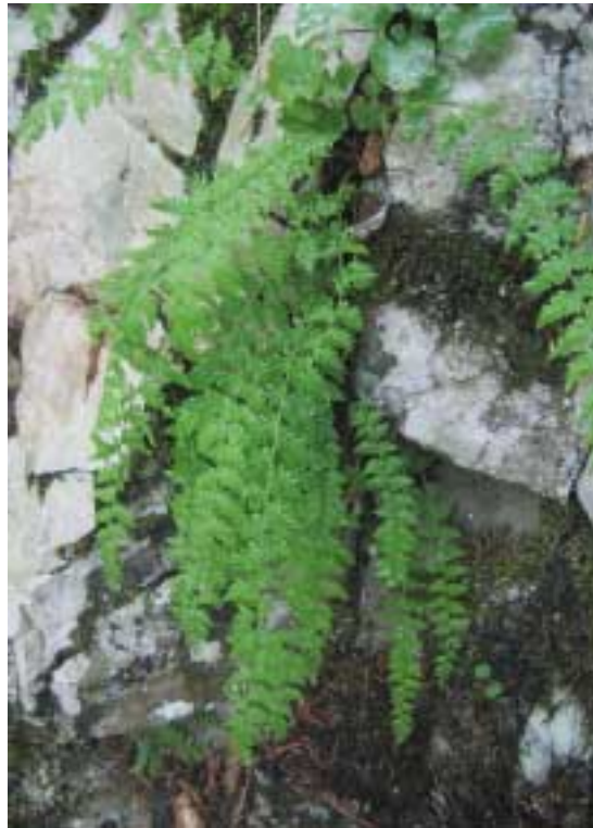
Вудсия ломкая ( Woodsia fragilis (Trev.) Moore) – вид, занесенный в Красную книгу РФ

Видеоизреживание древесного полога, поскольку в этом случае вследствие осветления на месте пихтарника возможно образование зарослей рододендрона, препятствующих возобновлению пихты.