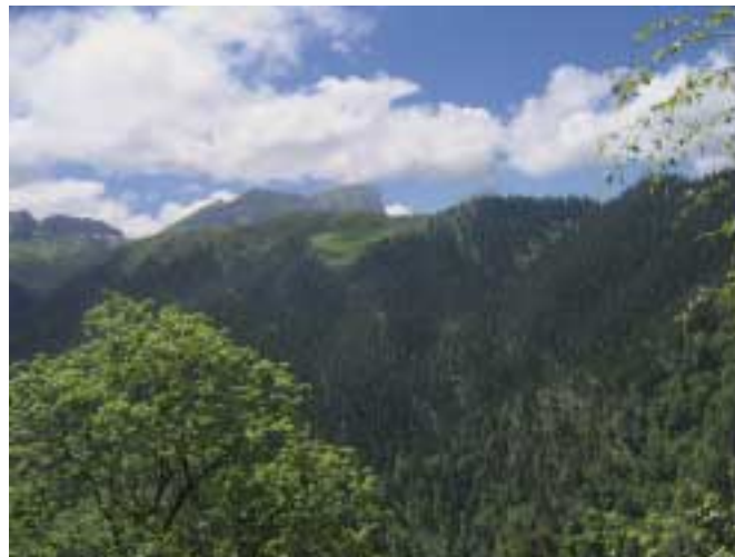
Пихтовые леса в бассейне р. Большой Ачешбок (верховья р. М. Лаба, Краснодарский край)